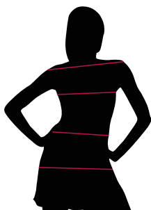
TABLE ST-K1 SLIM FIT